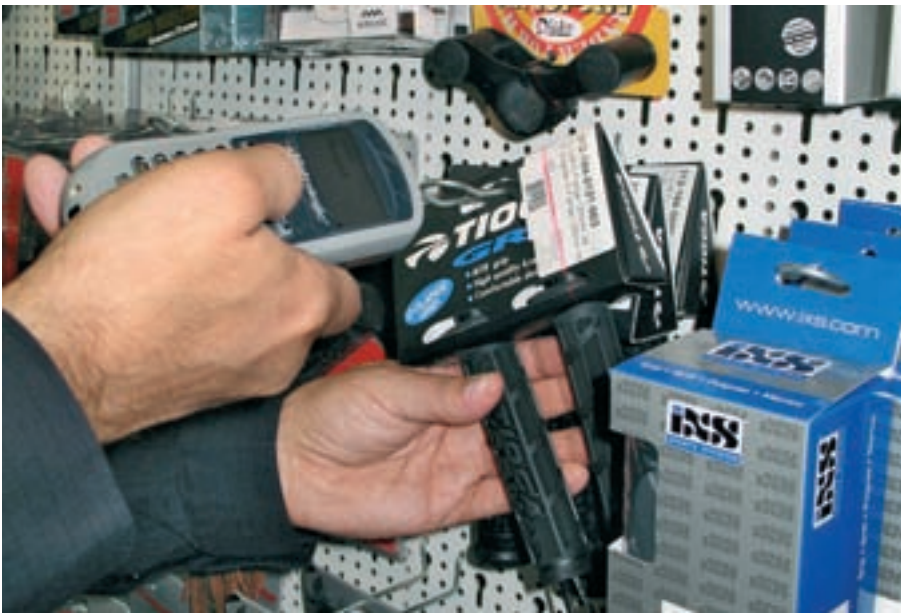
Mit einem portablen Lesegerät – hier von Abächerli Solutions – lassen sich die Artikel direkt am Regal inventarisieren.

malen, korrekten Kauf. Anschliessend wird der Bon kopiert und die gekaufte Ware mit dem Originalbeleg in der Kauffiliale wieder umgetauscht. Mit der Kopie reist der «Kunde» dann von Filiale zu Filiale und stiehlt dort die zum Bon passende Ware. Er entfernt die Warensicherung und tauscht die Artikel an den Kassen unter Vorlage der Bonkopien gegen Bargeld um.